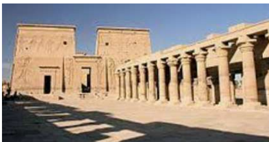
Templo de Philae, dedicado a Isis, está en una isla a orillas del rio, es conocido como la perla del Nilo.